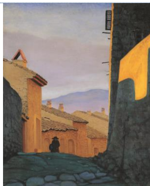
Felix VALLOTTON (1865-1925) Une rue à Cagnes, 1922 Huile sur toile, 81 x 65

Collection Christoph Blocher