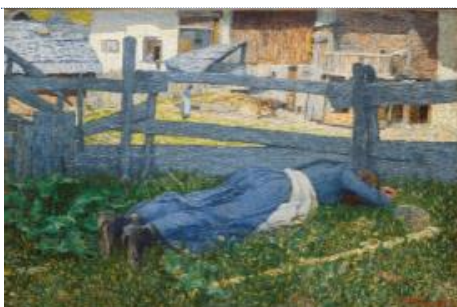
Giovanni SEGANTINI (1858-1899) Repos à l'ombre , 1892 Huile sur toile, 45 x 68

Collection Christoph Blocher