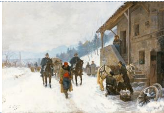
Edouard CASTRES (1838 – 1902) Paysage en hiver avec saltimbanques, ours savants et gendarmes, 1877 Huile sur toile, 75 x 110

Collection Christoph Blocher