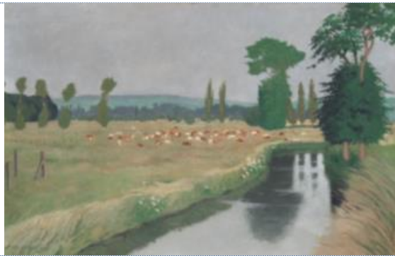
Felix VALLOTTON (1865 – 1925) Ruisseau à Aques-La Bateille, 1903 Huile sur toile, 66 x 101

Collection Christoph Blocher