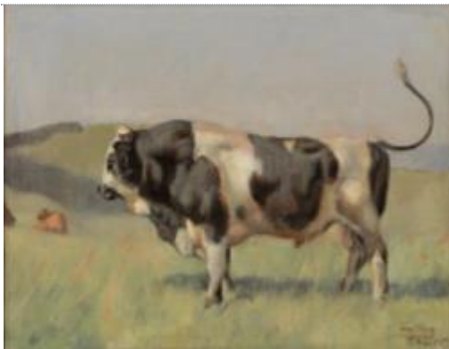
Ferdinand HODLER (1853 – 1918) Le taureau , vers 1885 Huile sur toile, 28 x 36

Collection Christoph Blocher © Photos SIK-ISEA, Zurich (Philippe Hitz)