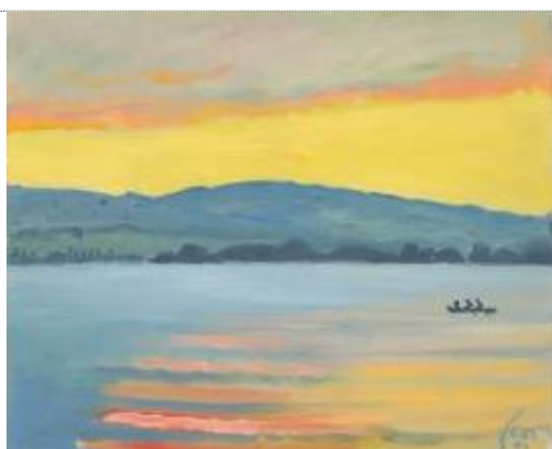
Cuno AMIET (1868-1961) Lac de Thoune avec chaîne de montagnes , 1931 Huile sur toile, 38 x 46

Collection Christoph Blocher