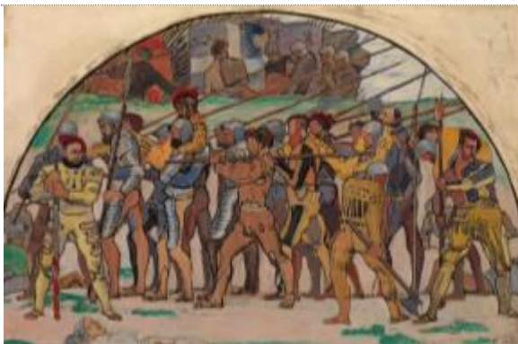
Ferdinand HODLER (1853 – 1918) Retraite de Marignan , 1897 Huile sur toile, 45 x 67

Collection Christoph Blocher