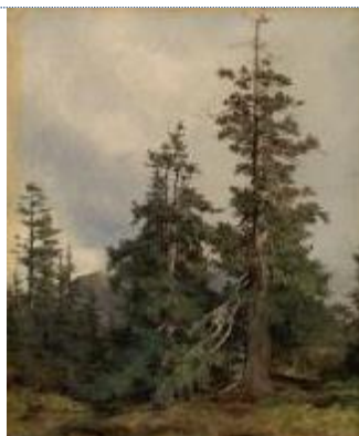
Alexandre CALAME (1810-1864) Grands sapins , non daté Huile sur papier sur toile, 52.3 x 43.3

Collection Christoph Blocher