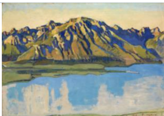
Ferdinand HODLER (1853 – 1918) Le Grammont vu de Caux le matin , 1917 Huile sur toile, 64 x 90.5

Collection Christoph Blocher