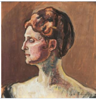
Ferdinand HODLER (1853 – 1918) Portrait de Berthe Hodler , 1916 Huile sur toile, 40.5 x 39.5

Collection Christoph Blocher