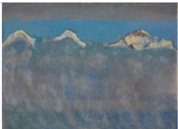
Ferdinand HODLER (1853 – 1918) L'Eiger, le Mönch et la Jungfrau au-dessus de la mer de brouillard , 1908 Huile sur toile, 69 x 93

Collection Christoph Blocher