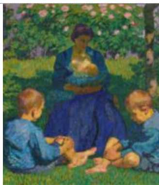
Giovanni GIACOMETTI (1868-1933) Maternité, 1908 Huile sur toile, 103.5 x 91

Collection Christoph Blocher