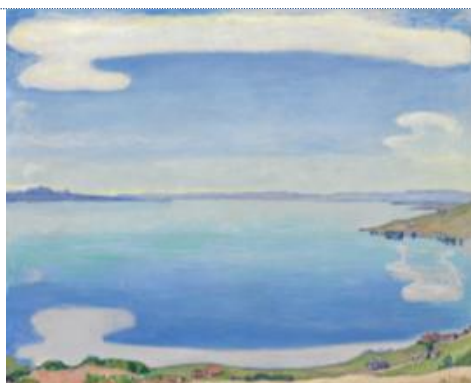
Ferdinand HODLER (1853 – 1918) Le lac Léman vu de Chexbres , vers 1904 Huile sur toile, 81 x 100

Collection Christoph Blocher