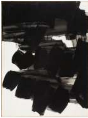
Photo © Centre Pompidou, MNAM-CCI, Dist. RMN-Grand Palais – © Jacqueline Hyde Soulages Pierre (né en 1919) © ADAGP, Paris ©2018, ProLitteris, Zurich

Centre Pompidou, MNAM-CCI , Paris Dépôt au musée d'Unterlinden, Colmar