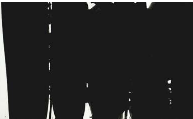
Peinture 220 x 366 cm, 14 mai 1968

Collection particulière, Suisse Soulages Pierre (né en 1919) © DR ©2018, ProLitteris, Zurich