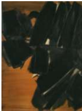
Peinture 81 x 60 cm, 21 mars 1961

© Soulages Pierre (né en 1919) © ADAGP, Paris ©2018, ProLitteris, Zurich