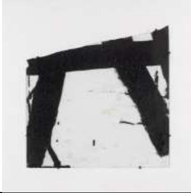
Goudron sur verre 45,5 x 45,5, 1948-2 été 1948