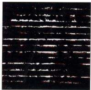
Soulages Pierre (né en 1919) © ADAGP, Paris ©2018, ProLitteris, Zurich