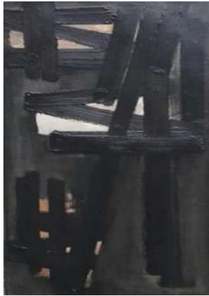
Peinture 46 x 33 cm, 16 juin 1953

Soulages Pierre (né en 1919) ©ADAGP, Paris ©2018, ProLitteris, Zurich